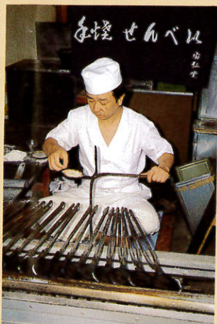
(弘前駅よりタクシー 約15分)